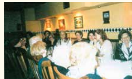
Η παράδοση της ιδρυτικής χάρτας

Σήμερα ο Όμιλος έχει 11 μέλη. Δεν υπάρχει κανένα από τα ιδρυτικά μέλη