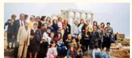
Η παράδοση της ιδρυτικής χάρτας