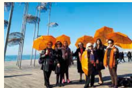
Νεότερη φωτογραφία του Ομίλου (Νοέμβριος 2019-Orange days)