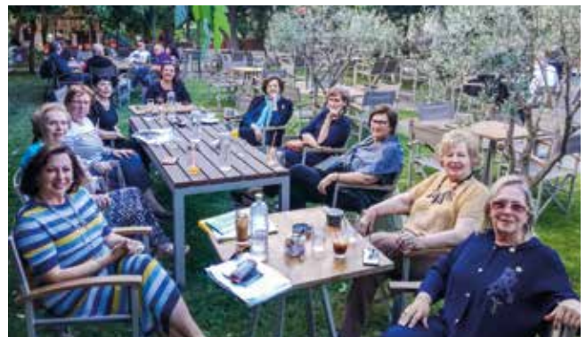
Τελευταία συνάντηση μελών Λάρισας - Α΄ Βόλου

προσπάθεια περιορισμού της μετάδοσης του Κοροναϊού. Λαμβάνοντας όλα τα μέτρα και τις αποστάσεις, όπως προτείνονται από τους αρμόδιους, βρεθήκαμε πολλές φίλες σε χώρο ανοιχτό και συγκεκριμένα στον υπέροχο διαμορφωμένο χώρο του roof garden του ξενοδοχείου ΠΑΡΚ. Η συγκίνηση και η χαρά μας ήταν μεγάλη, καθώς μετά από 2μισυ περίπου μήνες βρεθήκαμε και συζητήσαμε για θέματα του ομίλου μας και όχι μόνο, ενώ παράλληλα πραγματοποιήθηκαν και οι εκλογές για την ανάδειξη του νέου ΔΣ του Ομίλου για τη διετία 2020-2022.