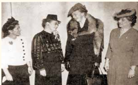
Η Πρώτη Κυρία των ΗΠΑ Eleanor Roosevelt, επίσημη καλεσμένη και ομιλήτρια σε εκδήλωση του Washington DC Club, το 1943.