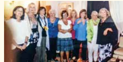
Νεότερη φωτογραφία του Ομίλου (2019)