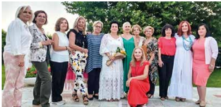
Το νέο Δ.Σ. της Θέτιδας για τη διετία 2020-2022

ολομέλεια, εκλογές, καινούργια πρόεδρο, υποδοχή νέων μελών, διασκέδαση, συντροφικότητα και πάνω απ’ όλα ομοθυμία για περισσότερο έργο.