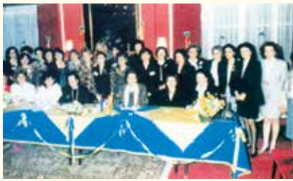
Η παράδοση της ιδρυτικής χάρτας