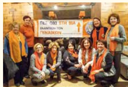
Νεότερη φωτογραφία του Ομίλου (Νοέμβριος 2019-Orange Days)