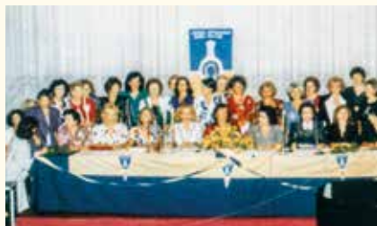
Η παράδοση της ιδρυτικής χάρτας

Έμβλημα: Η Υδρία. Θυμίζει το ψυχικό των κατοίκων που έδωσαν νερό στον μαραθωνομάχο όταν σταμάτησε για λίγο και συνέχισε να αναγγείλει στους Αθηναίους «νενικήκαμεν».