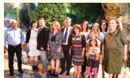
Νεότερη φωτογραφία του Ομίλου

Σήμερα ο Όμιλος έχει μόνο 3 μέλη. Κανένα ιδρυτικό και είναι υπό ανασυγκρότηση