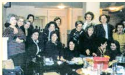
Η παράδοση της ιδρυτικής χάρτας