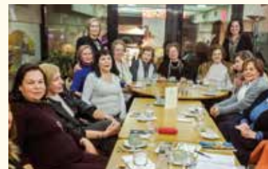
Νεότερη φωτογραφία του Ομίλου (Πίτα Ομίλου-Ιανουάριος 2020)

Σήμερα ο Όμιλος έχει 8 άτομα εκ των οποίων κανένα ιδρυτικό. Ο Όμιλος θα είναι σε αναστολή την επόμενη διετία και ανασύσταση.