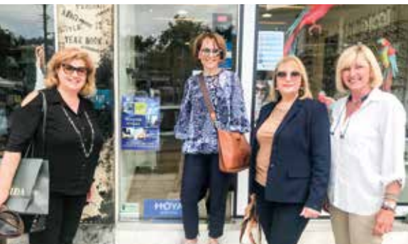
Ο Όμιλος «Πανόραμα» Θεσσαλονίκης εν δράσει