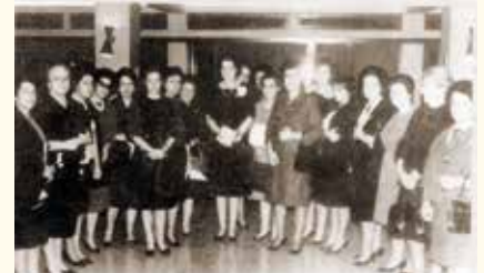
Η παράδοση της ιδρυτικής χάρτας