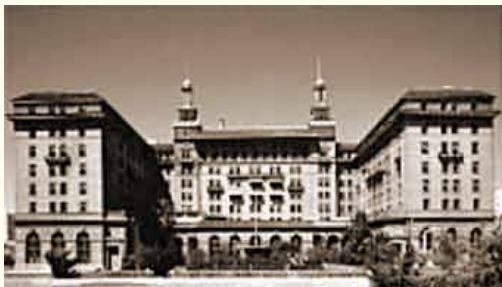
Hotel Oakland - η τοποθεσία των πρώτων ιστορικών συναντήσεων και ίδρυσης του Ιδρυτικού Soroptimist Club.