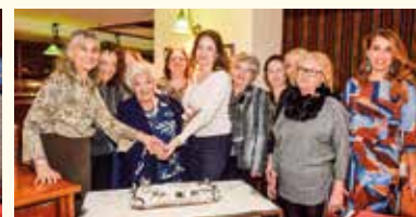
Νεότερες φωτογραφίες του Ομίλου (Ιανουάριος 2020, Κοπή Πίτας Ομίλου)