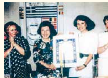
Η παράδοση της ιδρυτικής χάρτας