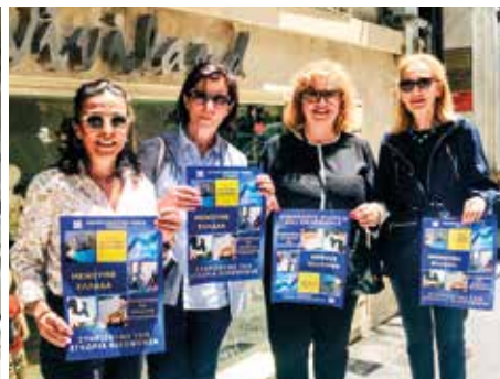
Ο Όμιλος «Ανατολικής» Θεσσαλονίκης εν δράσει