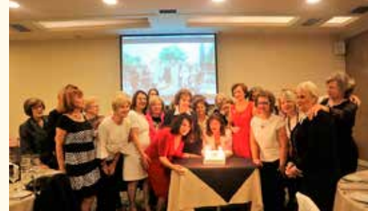
Νεότερη φωτογραφία του Ομίλου (Ιανουάριος 2020-Κοπή Πίτας)