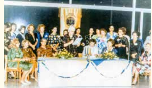
Η παράδοση της ιδρυτικής χάρτας