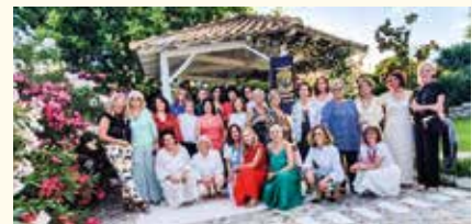
Νέοτερη φωτογραφία Ομίλου (Χειμώνας 2020)