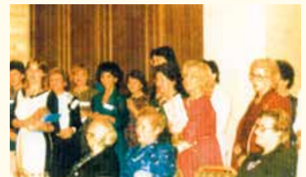
Η παράδοση της ιδρυτικής χάρτας