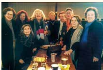
Νεότερη Φωτογραφία του Ομίλου (Κοπή Πίτας-Ιανουάριος 2020)

Στις 13 Δεκεμβρίου 1950 έγινε η επίσημη τελετή της ίδρυσης του Ομίλου. Την ιδρυτική χάρτα παρέδωσε η Dr Suzanne Noel (Γαλλία) Ιδρυτική Πρόεδρος του Α' Ευρωπαϊκού Ομίλου Παρισίων-Paris Fondateur, επί Προεδρίας SI/E Clara Hammerich (Δανία). Ιδρυτική Πρόεδρος του Σοροπτιμιστικού Ομίλου «ΙΔΡΥΤΙΚΟΣ» η Μαρία Φλαμπουριάρη .