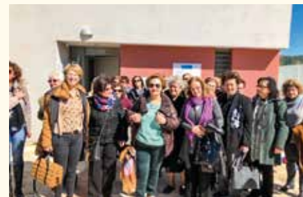
Νεότερη φωτογραφία του Ομίλου από επίσκεψη στα χωριά SOS το 2019