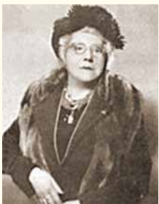
Dr. Suzanne Noël Charter President Soroptimist Club of Paris