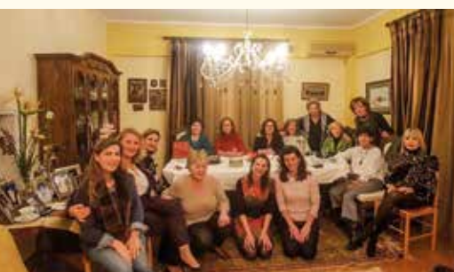
Νεότερη φωτογραφία του Ομίλου (Κοπή Πίτας, Ιανουάριος 2020)