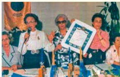
Η παράδοση της ιδρυτικής χάρτας

Έμβλημα: «Απήδαλος Ναυς». (Καράβι χωρίς πηδάλιο (τιμόνι), που από την Ομηρική Εποχή χρησιμοποιούσαν οι Φαίακες (πρόγονοι των Κερκυραίων) φημισμένοι για τη ναυτική τους ικανότητα).