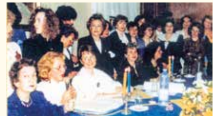
Η παράδοση της ιδρυτικής χάρτας