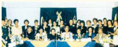
Η παράδοση της ιδρυτικής χάρτας