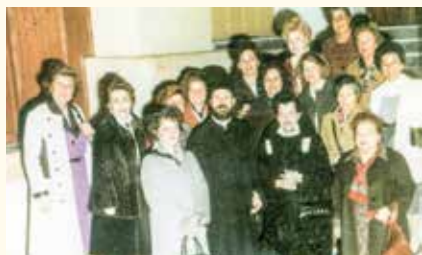
Η παράδοση της ιδρυτικής χάρτας

Έμβλημα: Ο Ποσειδάνας, θεός της θάλασσας, σε άρμα συρόμενο από θαλάσσιους ίππους. Το έμβλημα του Δήμου Π. Φαλήρου, ως παραθαλάσσια πόλη.