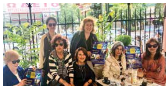
Ο Όμιλος «Βυζάντιο» Θεσσαλονίκης ξεκουράζεται μετά από την δράση

Η εκστρατεία μας φιλοξενήθηκε σε 2 εφημερίδες του Πειραιά (se-skerseis.gr και Η ΦΩΝΗ ΤΩΝ ΠΕΙΡΑΙΩΤΩΝ) και σε ένθετο στην εφημερίδα της Χρυσούπολης Καβάλας (Η ΦΩΝΗ ΤΟΥ ΝΕΣΤΟΥ).