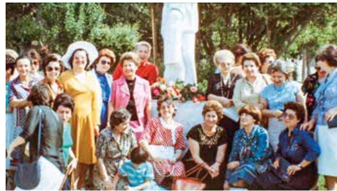
Γιορτή της Μάνας- Άνθη στο άγαλμα της μάνας, δώρο Α΄ Ομίλου Βόλου στην πόλη τους. Μάιος 1975.

Ο μοναδικός Όμιλος που έκανε εκδήλωση για την ημέρα της μητέρας το 2020 ήταν ο Α΄ Βόλου. Λόγω των ειδικών μέτρων για τον περιορισμό της διασποράς του κο-