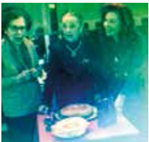
Η Πρόεδρος του Σ.Ο. «Ιδρυτικός» Αθηνών κόβει την πίτα του Ομίλου

Όπως κάθε χρόνο ο όμιλος Ψυχικού έκοψε την βασιλόπιτα του σε χαρούμενη εορταστική ατμόσφαιρα στο Ξενοδοχείο «Αμαλία».