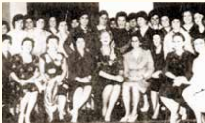
Η παράδοση της ιδρυτικής χάρτας