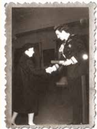
Η Πασιθέα Ζουρούδη με τον Βασιλέα των Ελλήνων Κωνσταντίνο