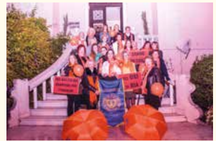
Νεότερη φωτογραφία του Ομίλου (Νοέμβριος 2019-Orange Days)