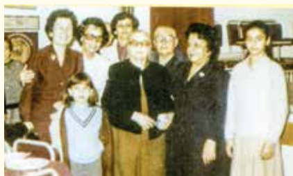
Η παράδοση της ιδρυτικής χάρτας

Έμβλημα: Η θεά Αθηνά, η θεά της Σοφίας. Έδωσε το όνομά της στην πόλη όπου ιδρύθηκε ο πρώτος Σοροπτιμιστικός Όμιλος στην Ελλάδα, ο Ιδρυτικός.