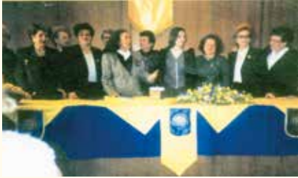
Η παράδοση της ιδρυτικής χάρτας