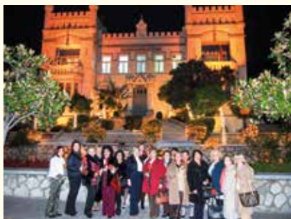
Νεότερη φωτογραφία Ομίλου (Orange Days-Νοέμβριος 2019)