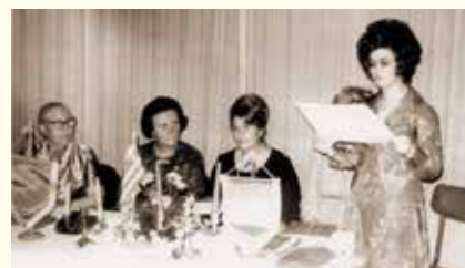
Η παράδοση της ιδρυτικής χάρτας