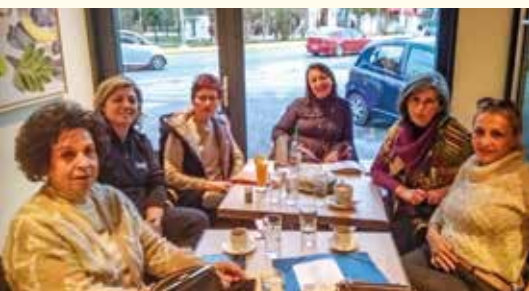
Νεότερη φωτογραφία του Ομίλου (Πίτα Ομίλου, Φεβρουάριος 2019)