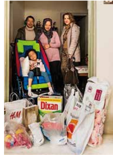
Μέλη του Ομίλου Λυκαβηττός με το κοριτσάκι και την μητέρα του