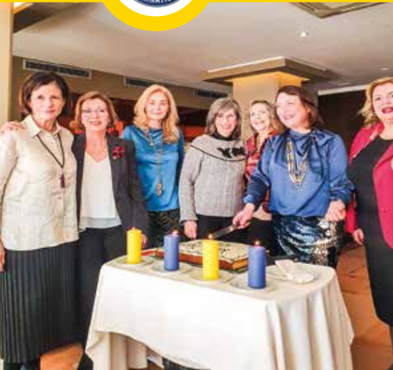
Οι Πρόεδροι των Ομίλων Βόλου, η Πρόεδρος και Αξιωματούχες της ΣΕΕ κόβουν την πίτα.