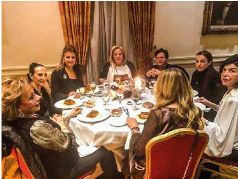
Μέλη του Σ.Ο. Κηφισιά-Εκάλη