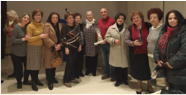
Ο Όμιλος Ηρακλείου στην εκδήλωση για την Ημέρα της Γυναίκας

θέμα «Εκτός από ...διδασκόμενες, οι Γυναίκες ενδιαφέρονται και για την υγιή και ενεργό γήρανση» αφιερώθηκε στις γυναίκες, πάσχουσες ή περιθάλπουσες, δεδομένου ότι οι διαταραχές της νόσου Alzheimer φαίνεται να προτιμούν τις γυναίκες.