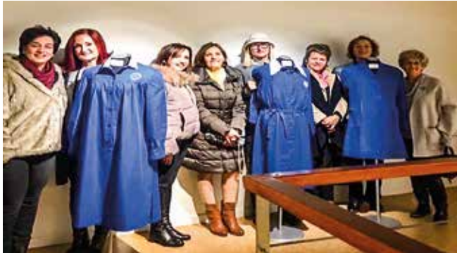
Μέλη της Θέτιδας στο Μουσείο της πόλης του Βόλου στην έκθεση «Ενθυμήματα του Γυμνασίου Θηλέων Βόλου 1921-1981».

> Σ.Ο. ΘΕΤΙΣ ΒΟΛΟΥ: Έγινε επίσκεψη του ομίλου Θέτις στο Μουσείο της πόλης του Βόλου και στην έκθεση «Ενθυμήματα του Γυμνασίου Θηλέων Βόλου 1921-1981»,