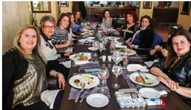
Μέλη του Σ.Ο. Α' Βόλος στο εορταστικό γεύμα