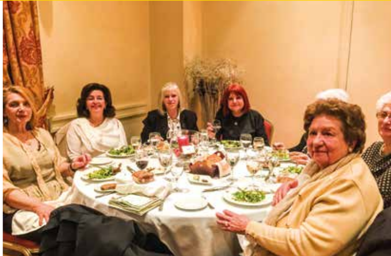
Το τραπέζι του Σ.Ο. Ψυχικό