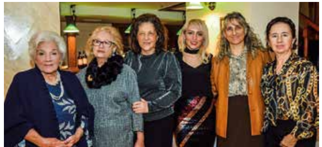
Παλιά και νέα μέλη του Σ.Ο. Ομίλου Πάτρας