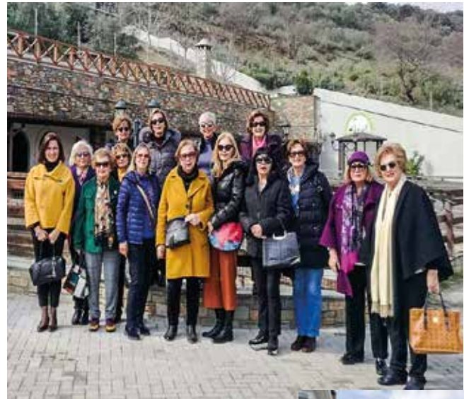
Σοροπτιμίστριες των δύο Ομίλων Βόλου και Λάρισας στην «κιβωτό του κόσμου» Μαγνησίας

τέρα Αντωνίου. Ο κάθε όμιλος πρόσφερε ένα μικρό χρηματικό ποσό σε επιταγές συνολικού ποσού 300 ευρώ, ενώ αγοράστηκαν και είδη ρουχισμού για τα μικρά παιδιά που φιλοξενούνται στο χώρο αυτό. Ακολούθησε ξενάγηση στον περιβάλλοντα χώρο, στα εργαστήρια και στο Γεωργικό Σχολείο, το οποίο λειτουργεί ανελλιπώς για την εκπαίδευση των 27 παιδιών που διαμένουν στην Κιβωτό. Το Γεωργικό σχολείο έχει δυο βασικούς στόχους. Αφενός, να προ-