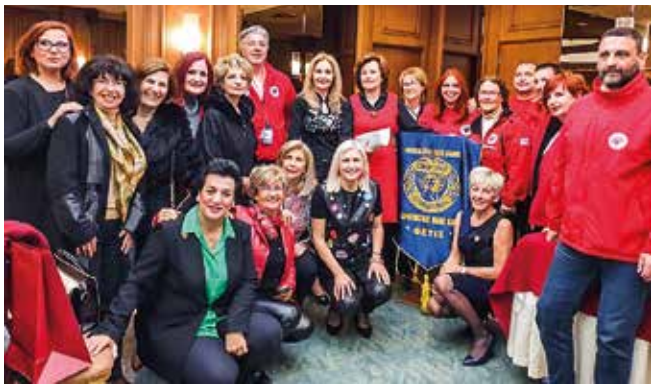
Μέλη της Θέτιδας και τα μέλη του τμήματος Κοινωνικής Μέριμνας και Ανθρωπιστικών Αποστολών της Ελληνικής Ομάδας Διάσωσης Μαγνησίας.

ομίλου μας είναι αποκλειστικά επιχορηγούμενη με το ποσό των 4.700 ευρώ από το «Active Citizens Fund» πρόγραμμα, που για την Ελλάδα διαχειρίζονται από κοινού το Ίδρυμα Μποδοσάκη και το SolidarityNow, μετά από την έγκριση της αίτησης που υποβάλλαμε τον Ιούνιο του 2019. Σύμφωνα με το επιδοτούμενο πρόγραμμα ορίζεται σαν χρόνος ολοκλήρωσης του προγράμματος η 31 η Ιουλίου 2020.