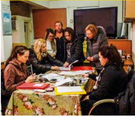
Επίσκεψη της ομάδας εργασίας της Θέτιδας στο «Σωματείο Μάγνητες τυφλοί».

κής ύλης, που θα χρησιμοποιηθούν για τα σεμινάρια εκμάθησης μπράι που οργανώνει το Σωματείο για ολόκληρο το 2020 για τυφλούς και επιθυμούντες να εκπαιδευτούν στη γραφή μπράι. Η δράση του