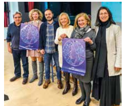
Εκδήλωση Medasset στο Σχολείο Δεύτερης Ευκαιρίας Αγίας Παρασκευής