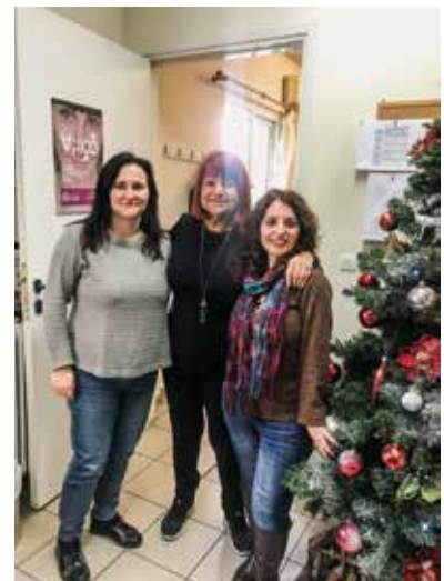
Η Πρόεδρος του Ομίλου Ψυχικού κατά την επίσκεψή της στο ΕΚΚΑ