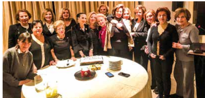
Η Πρόεδρος και τα μέλη του Ομίλου Κηφισιά-Εκάλη κόβουν την Πίτα τους. Μαζί τους η επίτιμη καλεσμένη τους Πρώην Πρόεδρος της ΣΕΕ Λένα Κουτσελίνη.

Σ.Ο. ΚΗΦΙΣΙΑ-ΕΚΑΛΗ: Η κοπή της πίτας του Σοροπτιμιστικού Ομίλου «Κηφισιά-Εκάλη» έγινε παρουσία της τέως Προέδρου της ΣΕΕ Λένας Κουτσελίνη στο