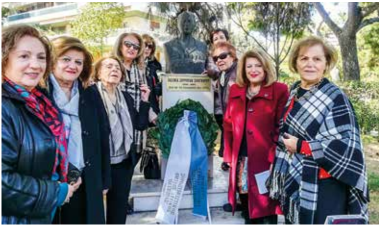
Κατάθεση Στεφάνου στην προτομή της Π.Ζουρούδη-Σαλιγγάρου, από Σοροπτιμίστριες

➤ Σ.Ο. ΟΛΥΜΠΙΑΣ: ο Σ.Ο. «Ολυμπίας» οργάνωσε στις 6 Μαρτίου κατάθεση στεφάνου στην προτομή της Πασιθέας Ζουρούδη-Σαλιγγάρου τιμώντας τη Γυναίκα που προ-