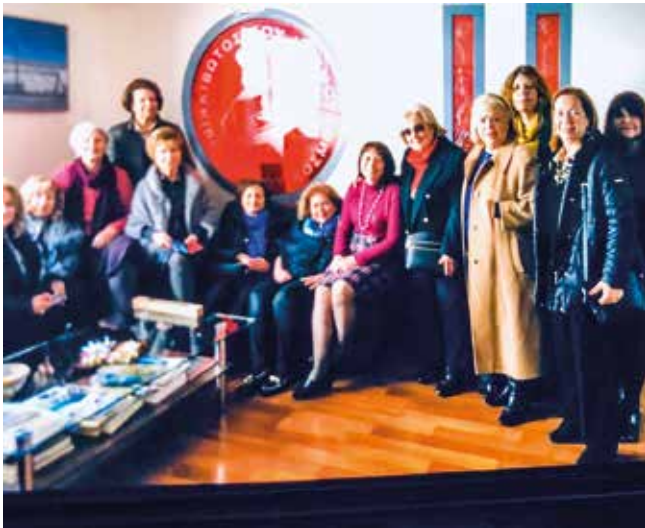
Εκπρόσωποι των Σοροπτιμιστικών Ομίλων της Αττικής στην «Κιβωτό του Κόσμου»

παιδιά απασχολούνται επίσης με ψυχαγωγικές, αθλητικές και άλλες δραστηριότητες, ώστε να τονωθεί η προσωπικότητά τους και να προβληθούν οι δεξιότητές τους. Διαθέτει, επίσης, Παιδικό Σταθμό για 50 λιλιπούτειους μαθητές μονογονεϊκών οικογενειών, Στέγη για την κακοποιημένη γυναίκα και ένα θησαυρό άλλων προγραμμάτων και δράσεων.