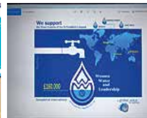
Η Βίλλυ Μάκου αναπτύσσει το θέμα της.