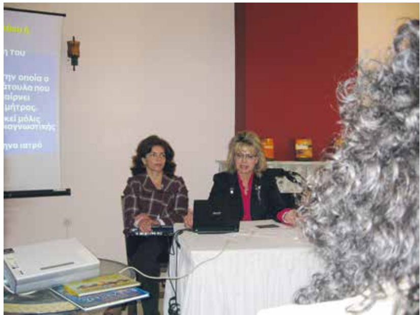
Στιγμιότυπο από την ομιλία

Μας ευχαρίστησαν από καρδιάς για την ενημέρωση και για την εξέτασή τους με το Τεστ Παπ