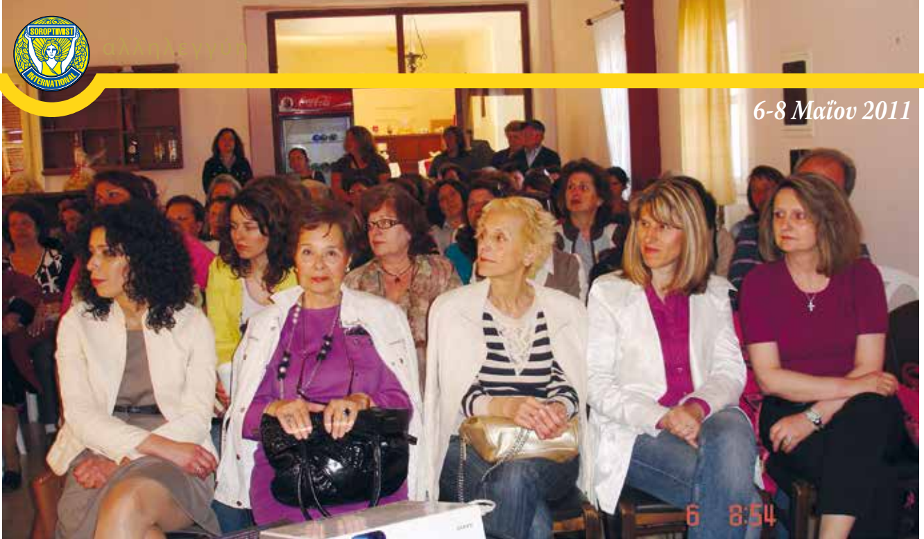
Μερική άποψη της αίθουσας στο Γεράκι κατά την διάρκεια των ενημερωτικών ομιλιών.