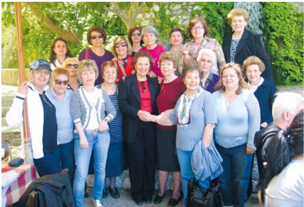
Αναμνηστική φωτογραφία των Σοροπτιμιστριών που συμμετείχαν