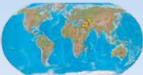
A small Island at the crossroads of Europe, Africa and Asia.