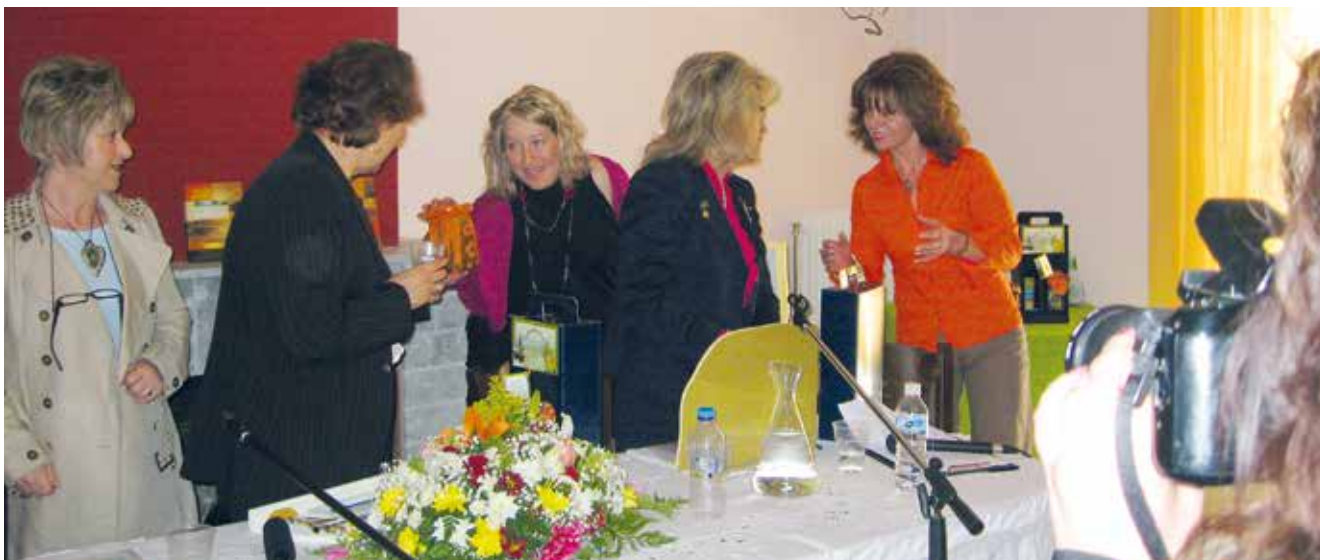
Από την προσφορά χειροποίητων κεραμικών από τον σύλλογο γυναικών