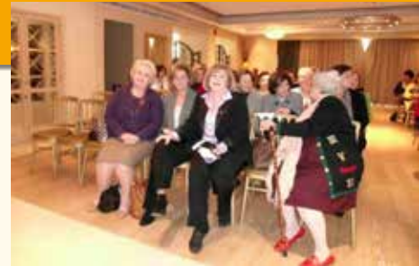
Αποφω της αίθουσας στο Εκάλη Κλαμπ

Η ομιλήτρια μάγεψε το ακροατήριο με την υπέροχη παρουσίαση της, καταχειροκροτήθηκε και η πρόεδρος του ομίλου δέχτηκε τα συγχαρητήρια των παρευρισκομένων για την θαυμάσια, υψηλού πνευματικού επιπέδου εκδήλωση.