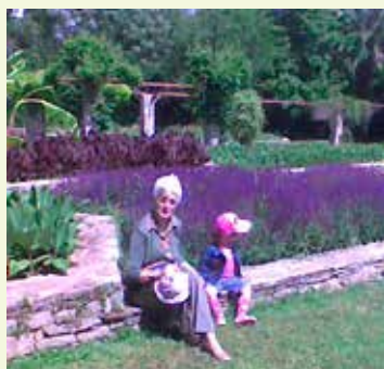
Την Κυριακή 22 Μαΐου επισκέφθηκα μαζί με τον άνδρα μου και την εγγονή μου τον Διομήδεο Βοτανικό Κήπο. Ήταν η καλύτερη εποχή. Πανδαισία χρωμάτων και αρωμάτων στον ανθόκηπο. Ολάνθιστος ο ροδόνας και οι λιμνούλες με τα νούφαρα. Μια όαση δροσιάς και αισθητικής, πολύ κοντά μας, αλλά εμείς τόσο μακριά της!

Οι Βοτανικοί Κήποι προσφέρουν πολλά στη διατήρηση της βιοποικιλότητας. Προστατεύουν σπάνια και απειλούμενα με εξαφάνιση φυτά. Συμβάλλουν στη συνειδητοποίηση του κοινού για τη σημασία και αξία των φυτών στον άνθρωπο και γενικότερα στο περιβάλλον. Ευαισθητοποιούν το κοινωνικό σύνολο