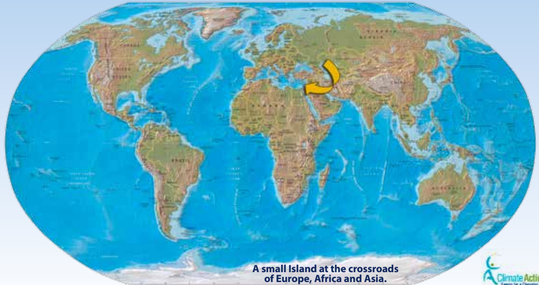
A small Island at the crossroads of Europe, Africa and Asia.