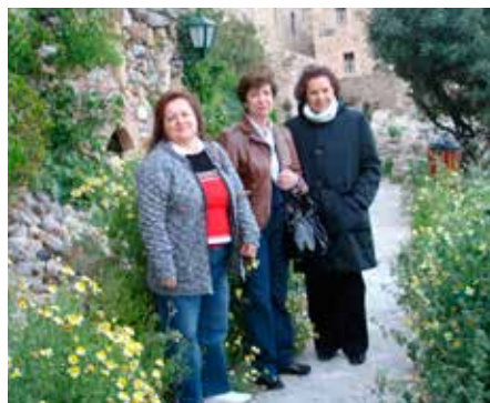
Βόλτα στα γραφικά σοκάκια της Μονεμβασιάς

ες εξεδήλωσαν την επιθυμία να συμμετάσχουν στην εξόρμηση αυτή και έτσι η αναχώρηση έγινε την Παρασκευή το πρωί 6 Μαΐου 2011, με πούλμαν, από την Αθήνα και με προορισμό τη Σκάλα Λακωνίας, το πολύ όμορφο ξενοδοχείο της οποίας αποτέλεσε την βάση παραμονής και εξόρμησης των συμμετεχόντων στην εκδήλωση αυτή.