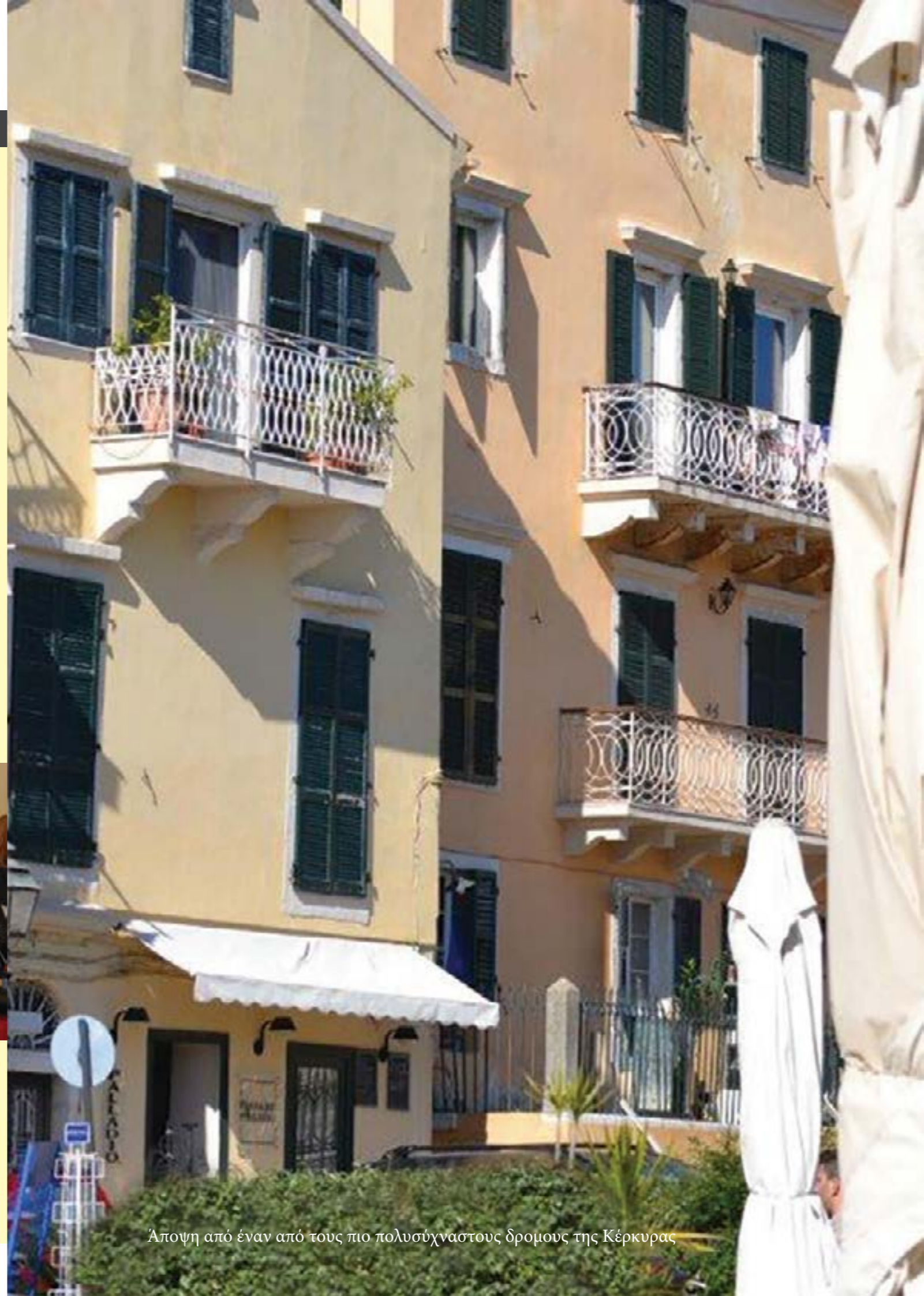
Άποψη από έναν από τους πιο πολυσύχναστους δρομους της Κέρκυρας