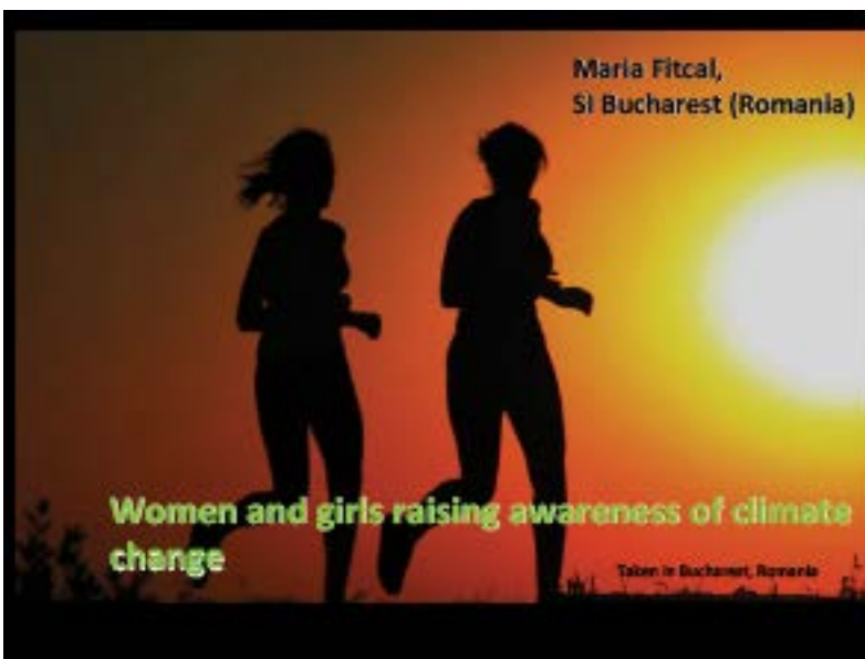
«Τρέχοντας μέσα στην ζέση» Ρουμανία