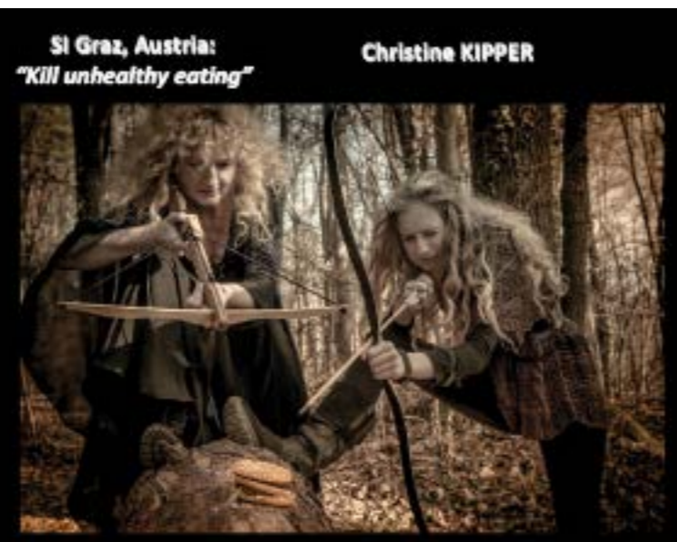
«Σκοτώστε την ανθυγιεινή διατροφή» Αυστρία